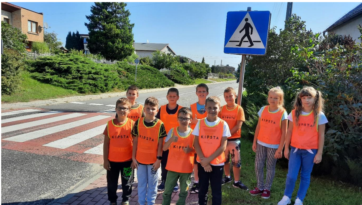
Uczniowie klasy III podczas spaceru