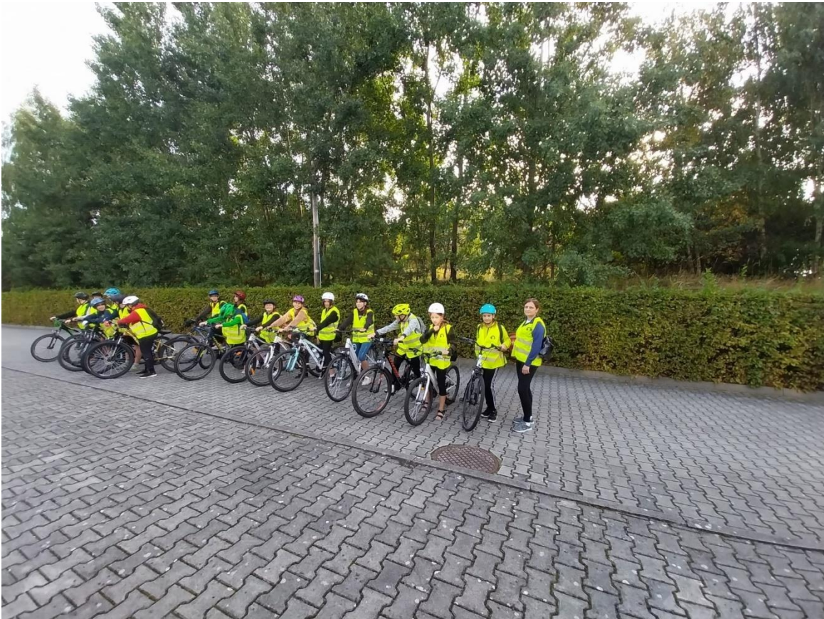
Uczniowie klas starszych, przygotowani do wycieczki rowerowej