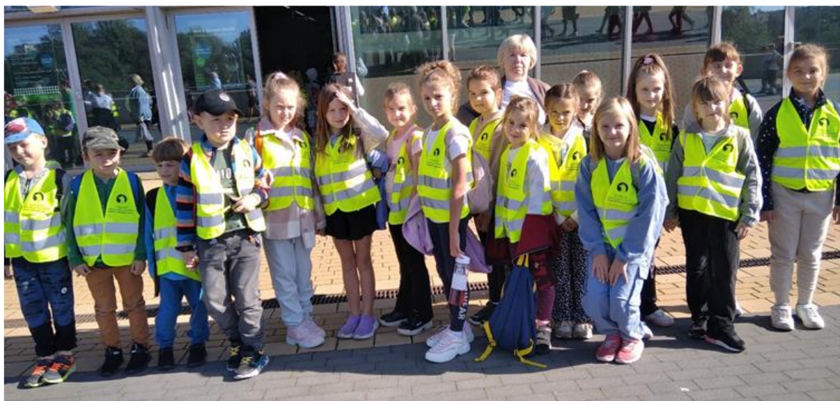
Uczniowie klasy II podczas „odblaskowej” wycieczki do Gliwic na rewią na lodzie